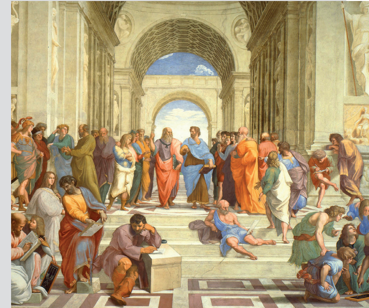
Titelbild: Raffael – Die Schule von Athen (1511). Das Fresco zeigt die wichtigsten Philosophenschulen des antiken Griechenlands, im Zentrum Platon und Aristoteles.

Die KU bei Facebook www.facebook.com/uni.eichstaett